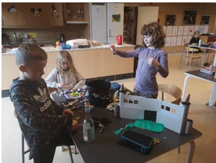
Udvikling af handlingen i fællesskab.